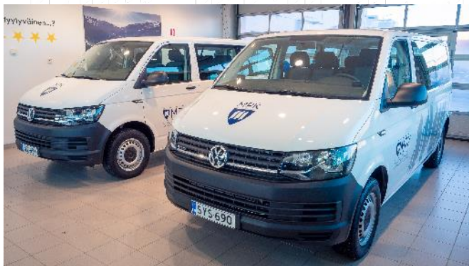
HA + PA + HPA