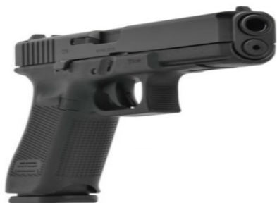
GLOCK 17 GEN 5 (9 mm)

Valmistelussa tarkkuuskiväärien jatkohankinta ml. M/23