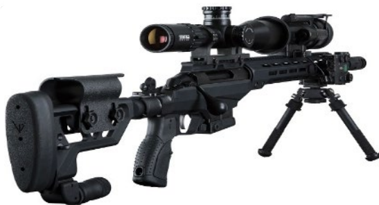
Tikka T3X TACT A 1 (308 WIN + 22 LR)