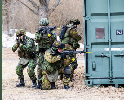
Taistelu rakennetulla alueella