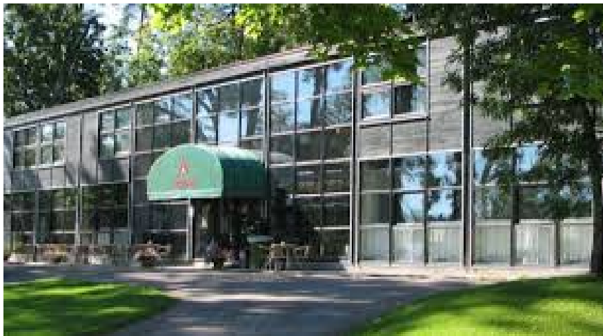
Messilän hotelli hiihtorinteen kupeessa

KORKEAN PAIKAN LEIRIN 2017 OHJELMA, KIRPPUTORI JA VIIHTYMISPALVELUT MESSILÄN KARTANOILLA JA HOTELLISSA PE-LA 22.-23.9.2017